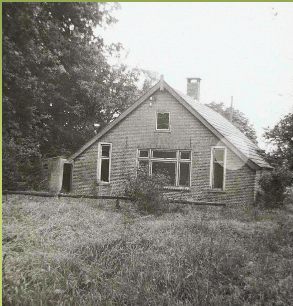
Schoot, boerderijtje, bestaande zuidwestgevel

Datum : onbekend Locatie : onbekend